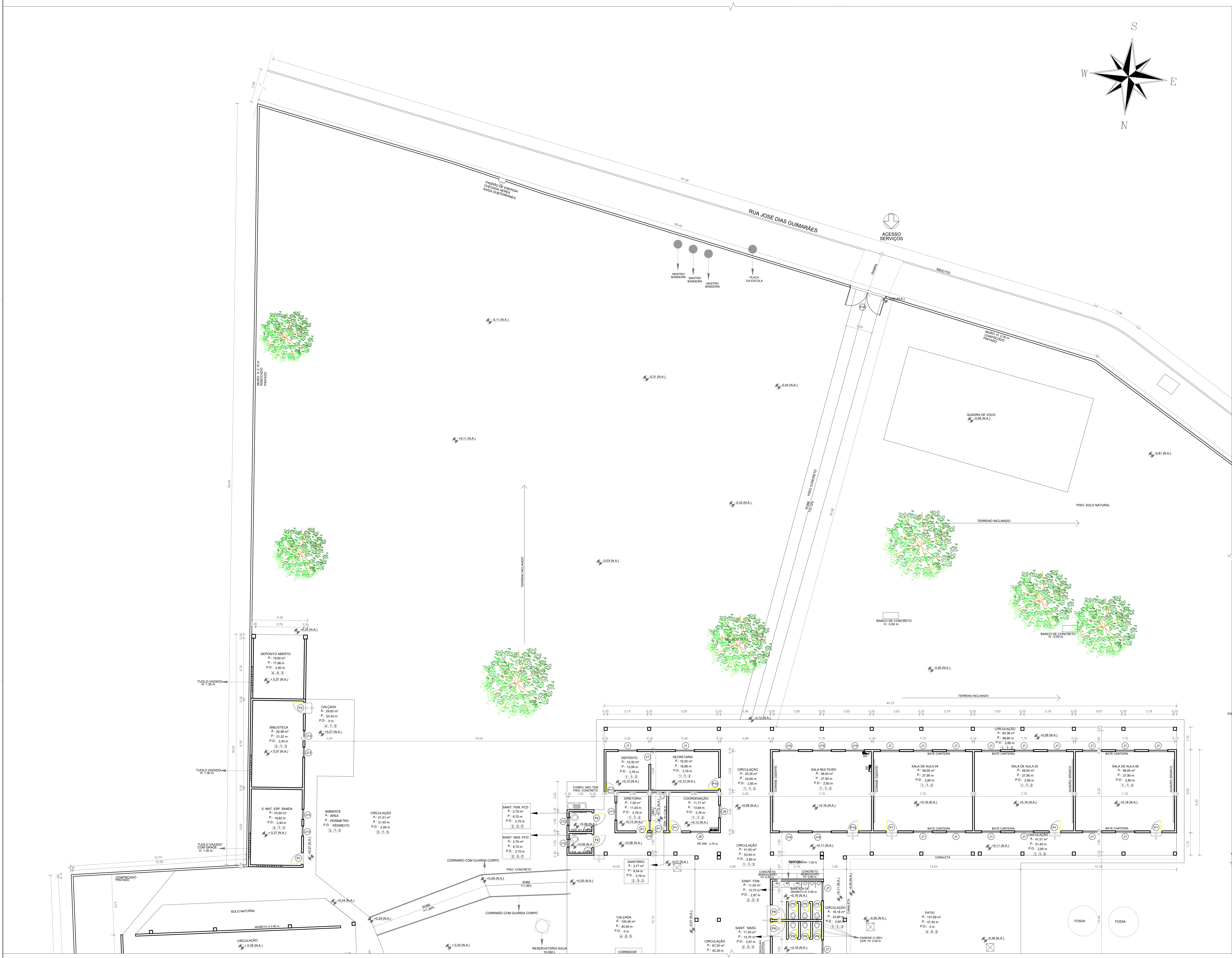
PLANTA BAIXA - EXISTENTE PARTE 1 ESCALA: 1:100